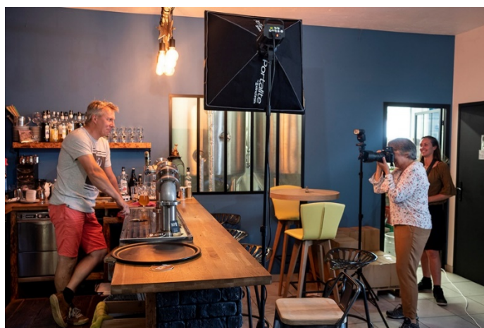
Stage Photo "portrait ambulatoire" avec Eric Garault

Cette initiative avec de nouvelles formules mises en place cette année, menée telle une expérimentation, aura permis de tester un dispositif et l'accueil du public pour ce type de proposition. Les stages photo visent à favoriser un lien avec les acteurs de la photographie professionnels et répondent à une attente du public en matière de pratique photographique en connexion avec le territoire.