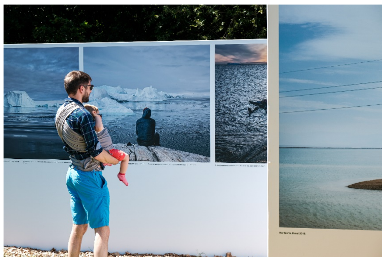
Le festival apporte une attention particulière à son public dès le plus jeune âge