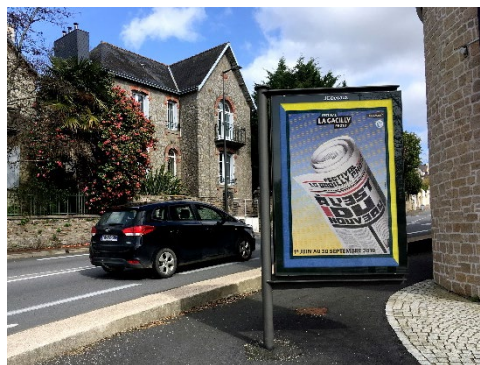
Campagne d'affichage JC-Decaux Quimper

Nous avons développé des annonces numériques via Affi Ouest aux points d'entrée de Rennes et de très nombreuses faces dans le Grand Ouest. Abri Services nous a mis à disposition son réseau d'affichage dans les villes de Nantes et de Rennes, JC Decaux ses emplacements sur les Champs Elysées et dans les grandes villes de l'Ouest (Quimper par ex.). L'ensemble de la campagne d'affichage a représenté plus de 2 000 faces au total.