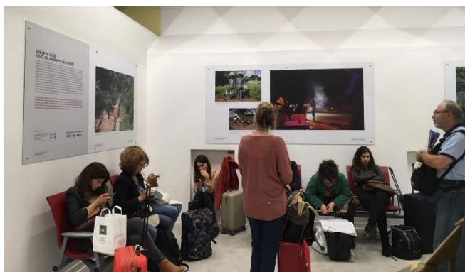
Exposition en gare de Paris Montparnasse – Hall 2