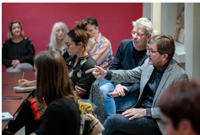
Réunion avec les mécènes locaux – Février 2019

Face à la volonté réaffirmée d'impliquer à ses côtés les acteurs du territoire, plusieurs réunions avec les mécènes locaux du festival ont été organisées en 2019. A l'écoute des remarques et problématiques de chacun, le festival s'est engagé à mieux accompagner les mécènes dans leur appropriation du festival. Leur ont ainsi été proposés des kits à destination de leurs clients, et une visite en avant-première des expositions. L'affichage d'un drapeau aux couleurs du Festival a été renouvelé cette année, permettant de rendre visible ces « ambassadeurs » de l'événement.