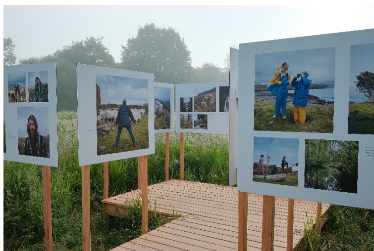
Exposition Isle of Eigg de Charles Delcourt

Cette démarche, que le festival souhaite renouveler en 2020 avec les futurs lauréats du concours, a été l'occasion d'explorer de nouvelles possibilités. Par exemple, celle d'aménager une plateforme au-dessus du marais de La Gacilly, tout en respectant cette zone naturelle sensible protégée (exposition Charles Delcourt).