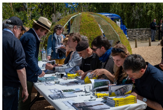
Séance de dédicace © Jean Michel NIRON

Une séance de dédicaces d'ouvrages, en partenariat avec la Librairie Larcelet, a également été organisée lors de l'inauguration mais placée cette année au cœur de l'événement, en extérieur, sur la Place de la Ferronnerie pour permettre à l'ensemble du public, professionnel et amateur, de rencontrer les artistes de la programmation.