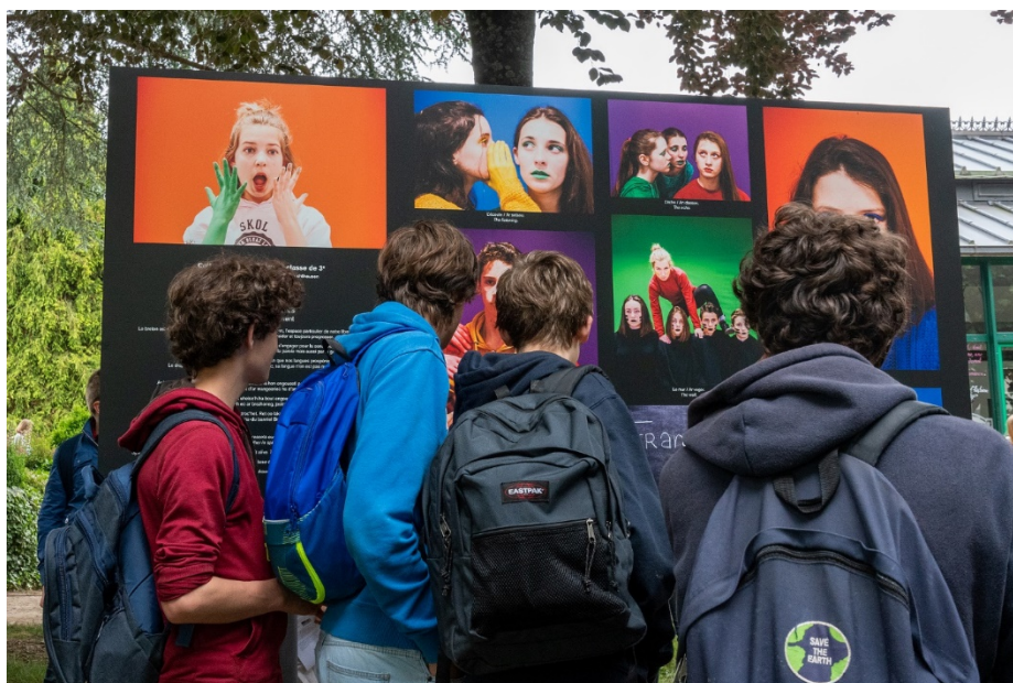
Inauguration du Festival Photo des Collégiens. Des élèves du Collège Diwan de Vannes découvrent leur panneau mis en place.