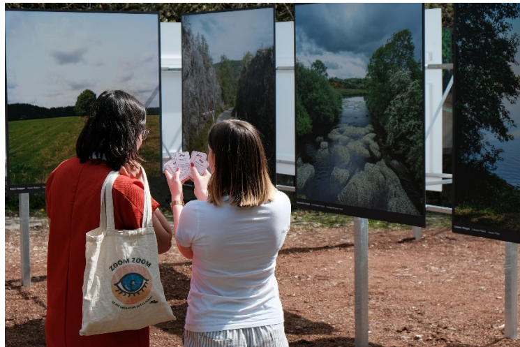
Le sac zoom zoom © Michel SEGALOU

Le sac zoom zoom pour le jeune public est un outil d'auto-médiation réalisés en 20 exemplaires en 2019 (contre 10 exemplaires en 2018). A l'intérieur, un jeu de 32 cartes, des lunettes « d'obscurité », une ardoise et ses craies, et d'autres outils de médiation pour regarder les expositions autrement. Devant chaque exposition, le festivalier doit tirer une carte au hasard et commencer à jouer. Cet outil, transposable sur n'importe quelle exposition a été complété et amélioré avec, cette année encore, le soutien de deux bénévoles diplômés du Brevet Professionnel Jeunesse, Éducation Populaire et Sport.