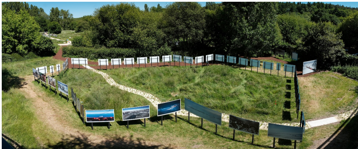
Vue de l'exposition Arctique : Nouvelle frontière, une double expédition polaire de Yuri Kozyrev & Kadir Van Lohuizen – Fondation Carmignac - © Michel Ségalo – Festival Photo La Gacilly 2019

Le choix des matériaux et des structures utilisés entre dans une logique de développement durable : bois sourcés localement, issus de forêts éco-gérées, structures modulables, réutilisables pour les prochaines éditions, rebus après démontage donnés ou réutilisés en interne.