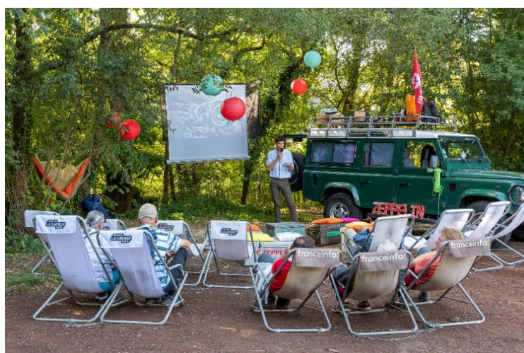
Projection en plein air avec l'agence Zeppelin

A 10 jours de la fermeture de cette 16 e édition consacrée aux Pays de l'Est, et après plusieurs semaines de météo capricieuse, les Journées européennes du patrimoine ont rassemblé un public nombreux : sur les trois jours, 1350 festivaliers ont profité des animations et outils de médiation du festival, sur 8436 visiteurs en totalité.