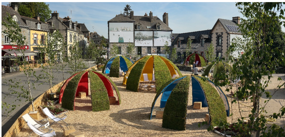
Place de la ferronnerie