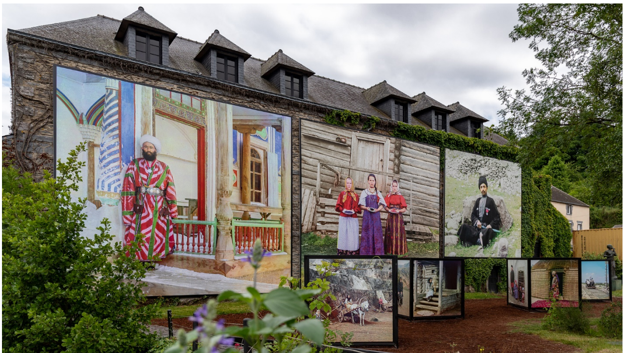
Exposition Prokoudine-Gorsky

Récompensée par un prix au Festival Visa pour l'Image et de la Fondation Lagardère, Kasia Strek a soulevé une question d'actualité dans son pays natal, la Pologne : l'exploitation massive du charbon à l'heure des énergies renouvelables.