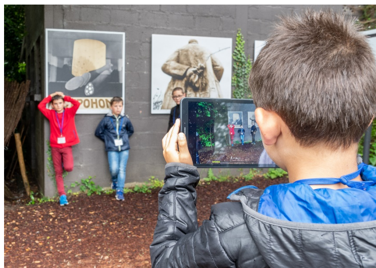
Des visites et des ateliers pédagogiques permettent une découverte pratique et ludique de la photographie

En 2019, 246 jeunes visiteurs ont participé à ces visites ou ateliers pédagogiques.