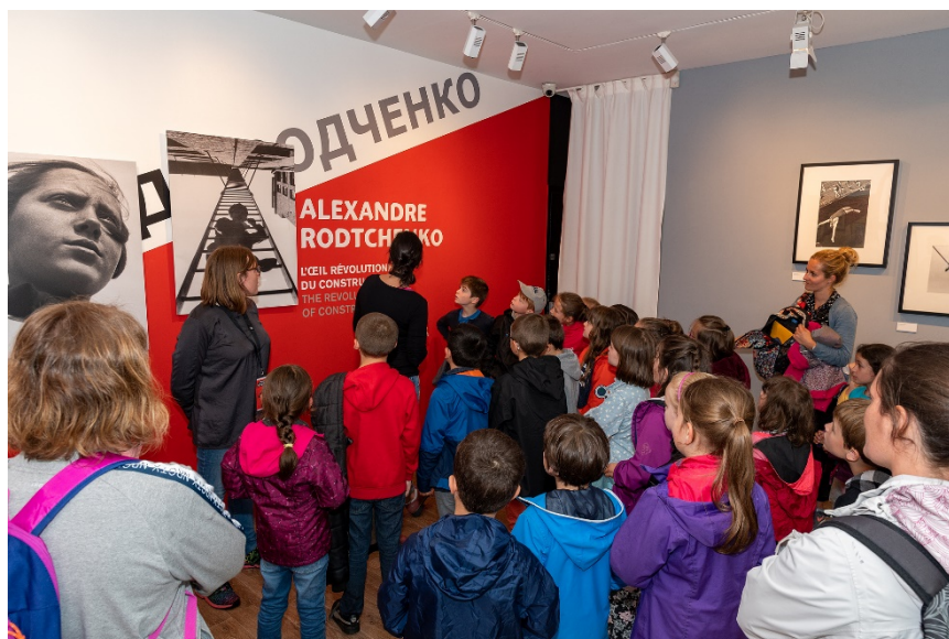
Une classe de CP-CE1 découvre le constructivisme russe à travers l'exposition Rodchenko, avant un atelier