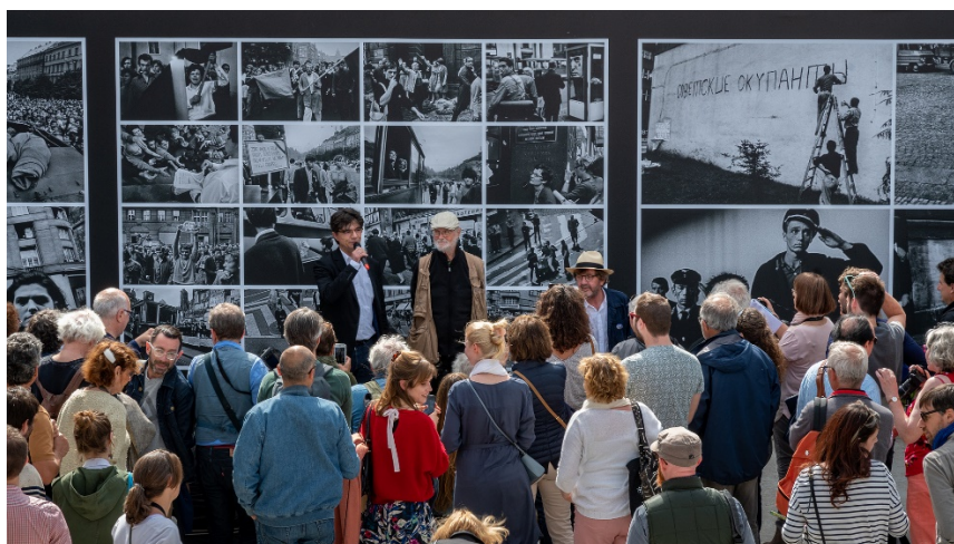
Visite de l'exposition avec Joseph Koudelka

Pour la première fois en 2019, des rencontres à destination du grand public ont été organisées lors du samedi inaugural. En accès libre, les visiteurs ont pu découvrir les expositions en compagnie de leurs auteurs et échanger avec ceux-ci. 15 rencontres ont ainsi créé l'événement, rassemblant plusieurs centaines de festivaliers autour de grandes figures de la photographie, tel Joseph Koudelka.